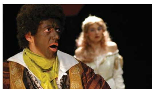
ALEXANDRE DUMAS, JEAN-PAUL SARTRE • KEAN