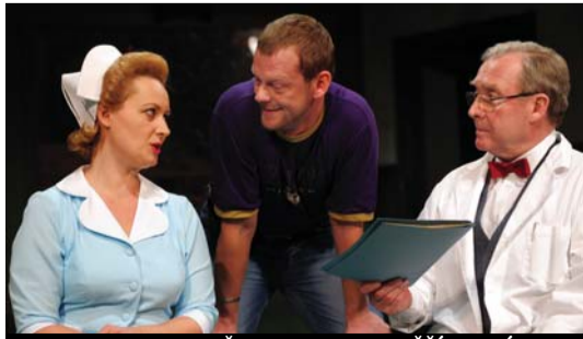
DALE WASSERMAN • PŘELET NAD KUKAČČÍM HNÍZDEM