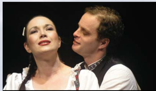
GABRIELA PREISSOVÁ • GAZDINA ROBA