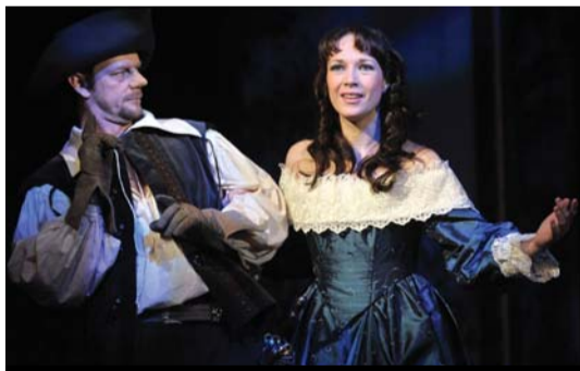
EDMOND ROSTAND • CYRANO Z BERGERACU