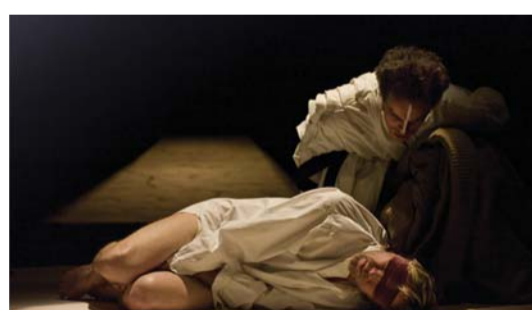
SOFOKLÉS • OIDIPÚS VLADAŘ