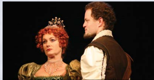
ROBERT BOLT • AŽ ŽIJE KRÁLOVNA!